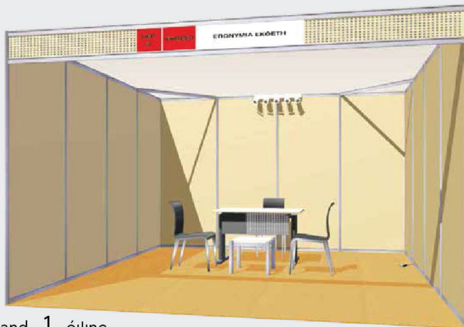
Stand 1 όψης